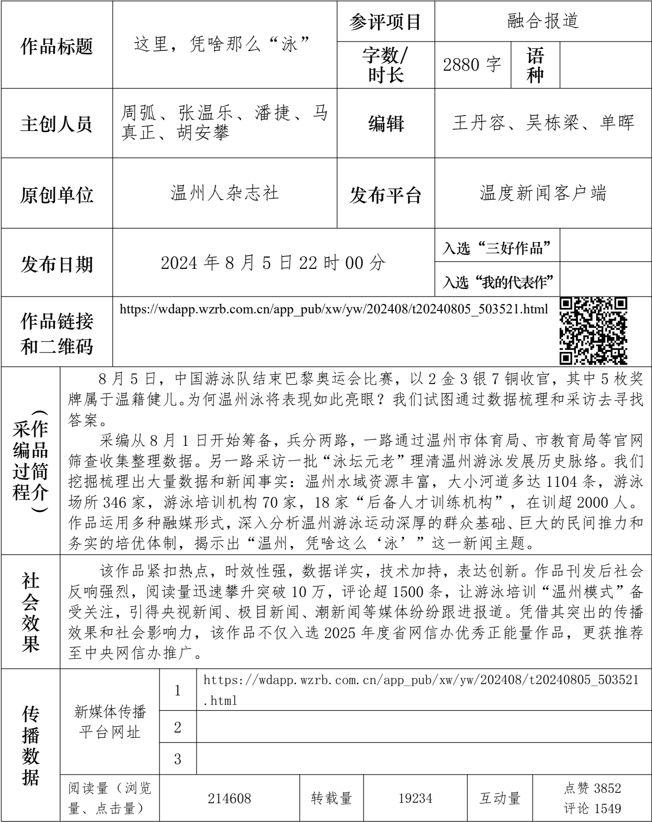
融合报道、应用创新参评作品推荐表